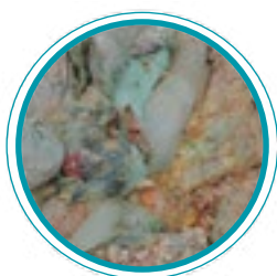
Biodéchets RESTAURATION & CANTINES 3 à 5 T/h