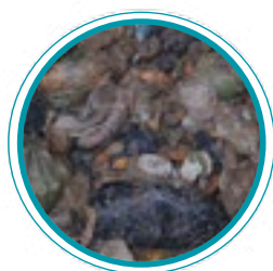
Biodéchets DES MÉNAGES 3 à 5 T/h