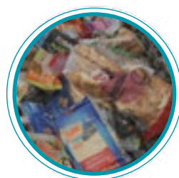
Biodéchets SUPERMARCHÉS 5 à 8 T/h